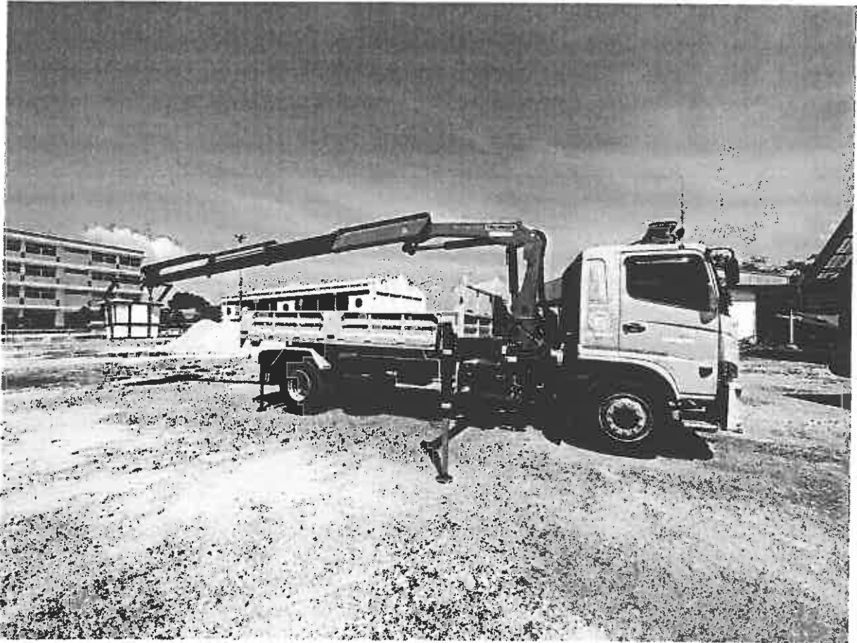
(ภาพประกอบตัวอย่างเท่านั้น)