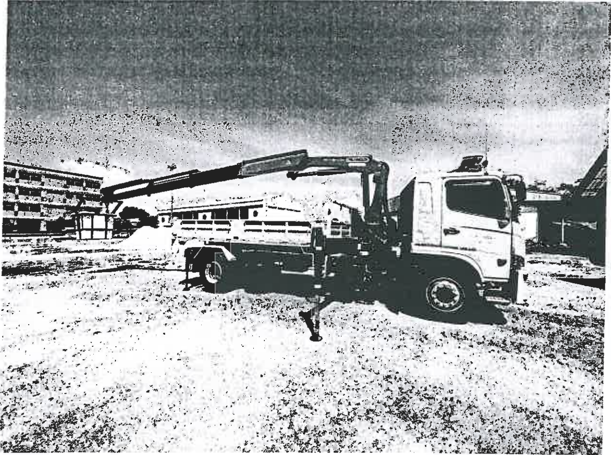
(ภาพประกอบตัวอย่างเท่านั้น)