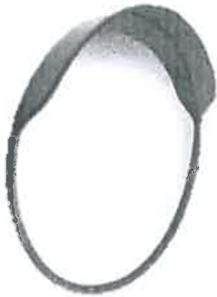
ภาพนี้เป็นภาพประกอบตัวอย่างเท่านั้น

สัญญาณไฟกระพริบพลังงานแสงอาทิตย์ (ไม่รวมเสา)