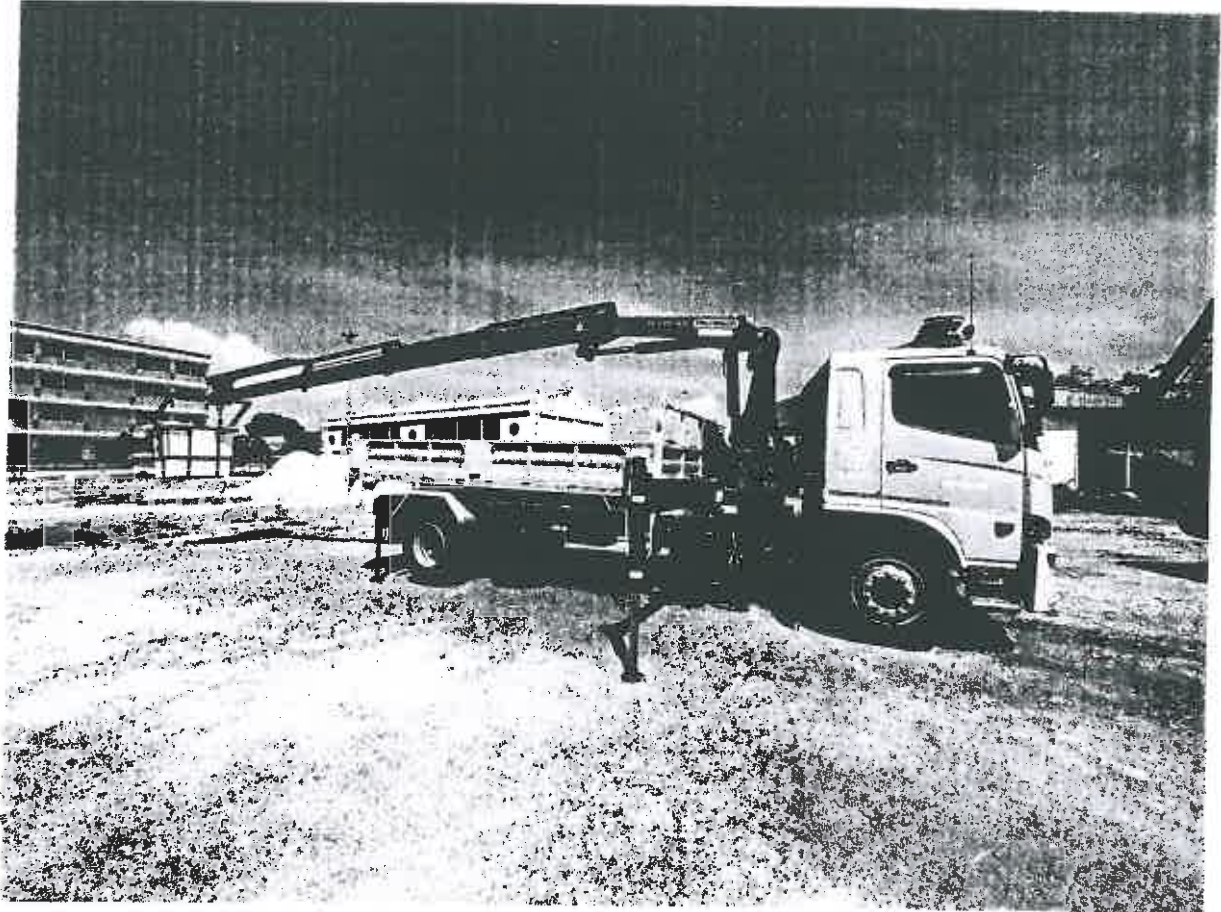
(ภาพประกอบตัวอย่างเท่านั้น)