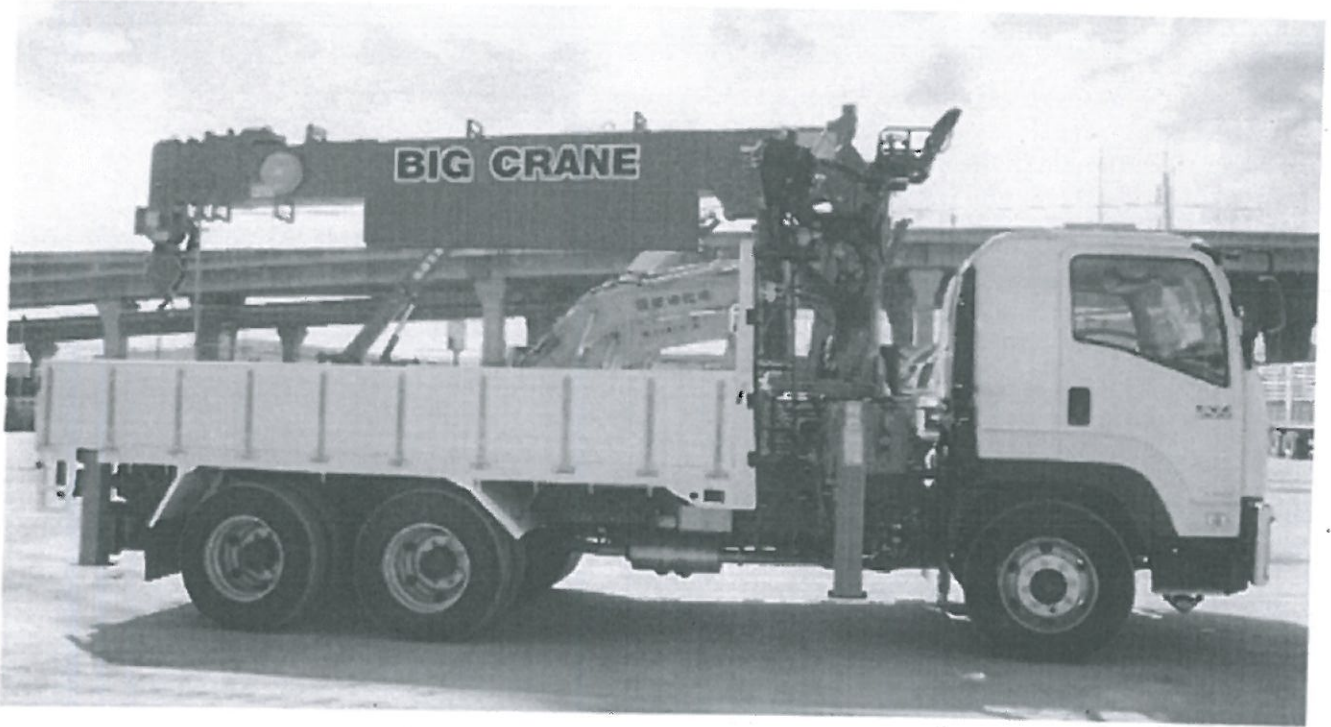
ภาพประกอบตัวอย่างรถบรรทุกชนิด 6 ล้อ ติดตั้งเครนสลิง (ใช้เป็นภาพประกอบตัวอย่างเท่านั้น)